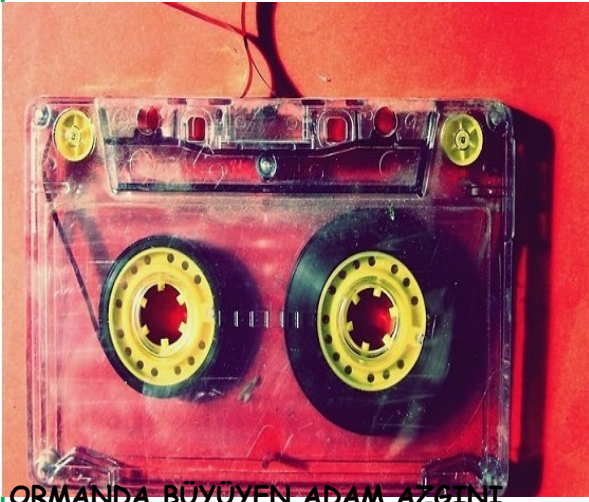
ORMANDA BÜYÜYEN ADAM AZGİNLİ

Ormanda büyüyen adam azgını Çarşıda pazarda insan beğenmez Medrese kaçını softa bozgunu Selâm vermek için kesen beğenmez